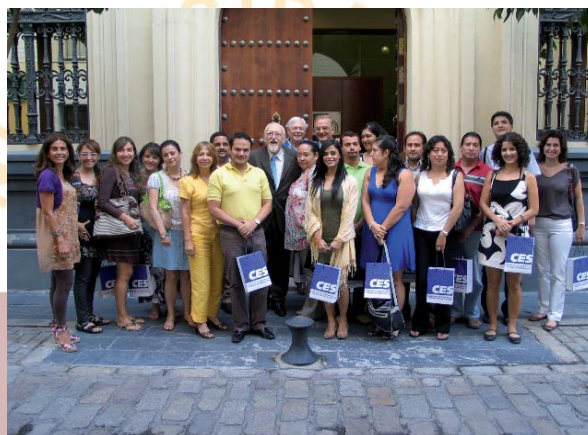
Con el Presidente del Consejo Económico y Social