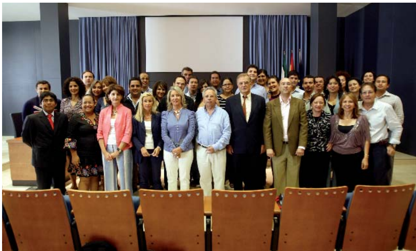
Aumnos de la 3ª edición del Curso Avanzado con las autoridades académicas.

Muy cercana a otras ciudades legendarias como Granada o Córdoba, ella misma fue puerto y puerta de América durante varios siglos, en los que se impregnó del espíritu intercontinental y lo transmitió a las generaciones presentes.