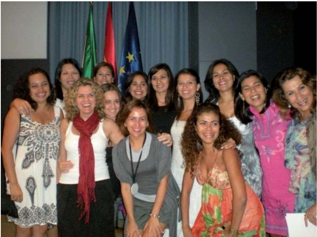
Sonrisas en el día de la graduación

Una puesta al día viva y en muchos casos procedente de los propios alumnos, en Facebook, "IERI SEVILLA".