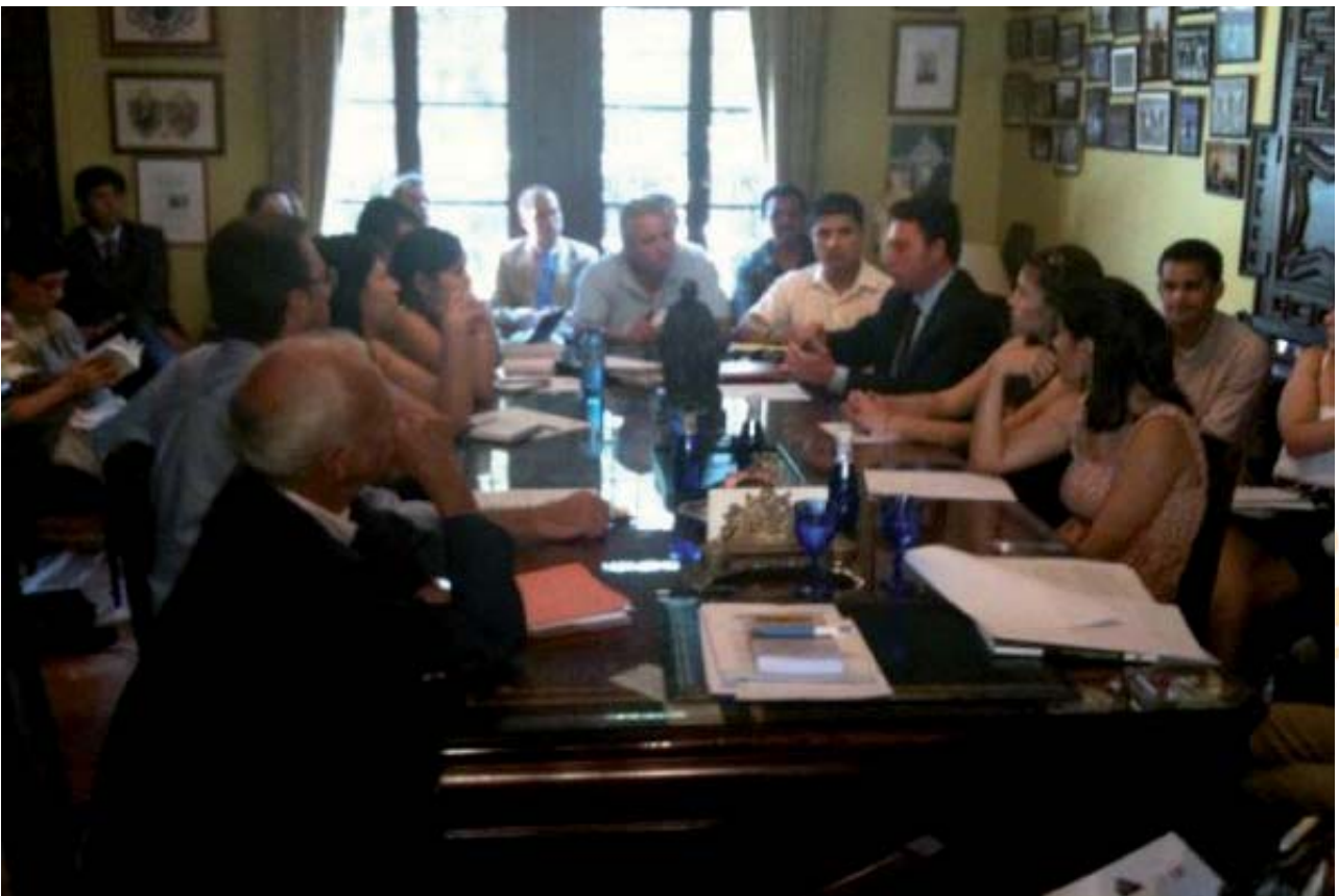
Un debate con abogados de la ciudad sobre el tema monográfico