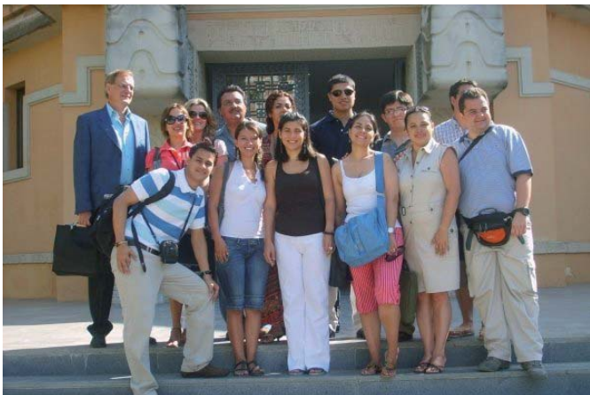
Alumnos en el Pabellón de México, sede del Postgrado

Con una población de 750.000 habitantes, Sevilla dispone de palacio de la ópera www.teatromaestranza.com , teatros www.sevillaweb.info/ocio/teatros/index.html , coso taurino, dos equipos de fútbol de primera división, y un aeropuerto que conecta en vuelos directos y de bajo coste con París, Roma, Londres, Lisboa y otras ciudades europeas en dos horas y media normalmente. Dispone de un tren de alta velocidad que la conecta con Madrid en otras dos horas y media.