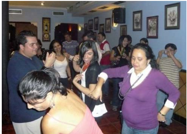
Diversión en el establecimiento “Lo nuestro”