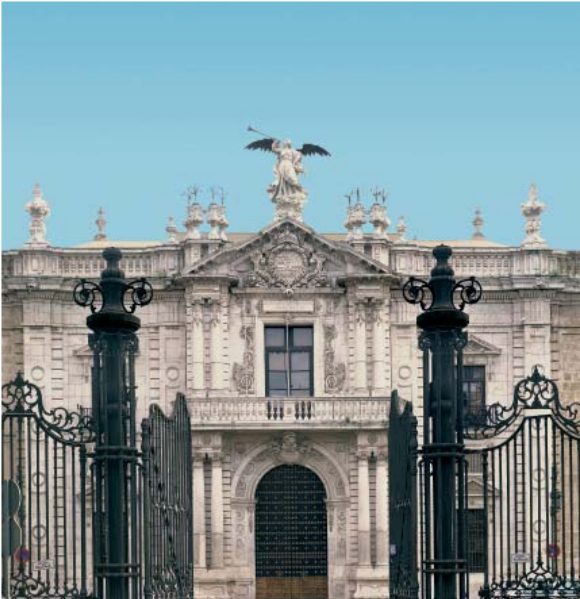
Rectorado de la Universidad de Sevilla en su sede del siglo XVIII