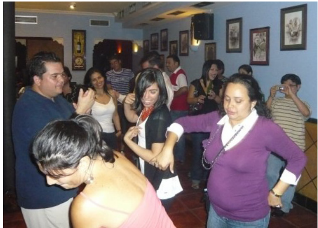
Diversión en el establecimiento “Lo nuestro”