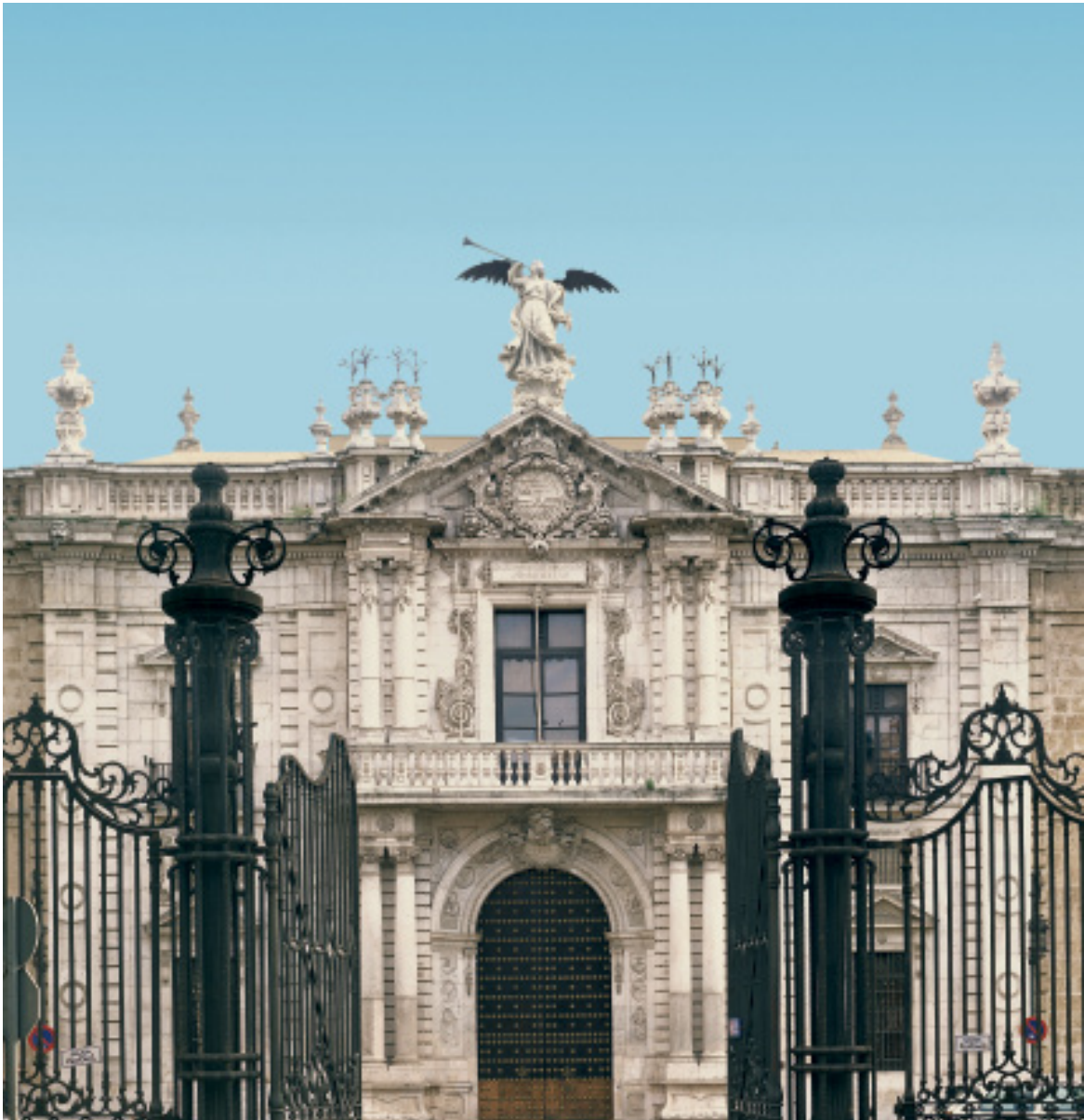
Rectorado de la Universidad de Sevilla en su sede del siglo XVIII