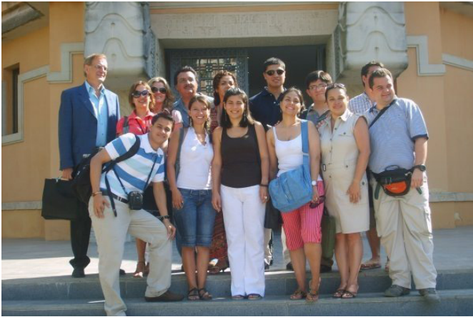
Alumnos en el Pabellón de México, sede del Postgrado

Con una población de 750.000 habitantes, Sevilla dispone de palacio de la ópera www.teatromaestranza.com , teatros www.sevillaweb.info/ocio/teatros/index.html , coso taurino, dos equipos de fútbol de primera división, y un aeropuerto que conecta en vuelos directos y de bajo coste con París, Roma, Londres, Lisboa y otras ciudades europeas en dos horas y media normalmente. Dispone de un tren de alta velocidad que la conecta con Madrid en otras dos horas y media.