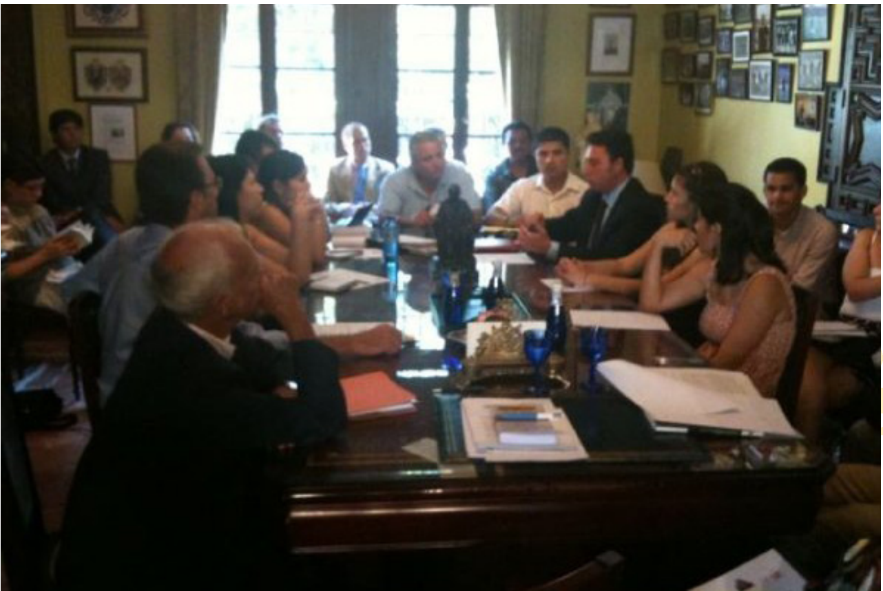
Un debate con abogados de la ciudad sobre el tema monográfico