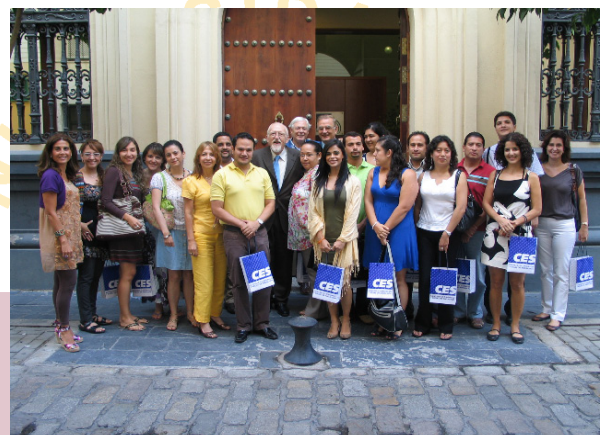
Con el Presidente del Consejo Económico y Social