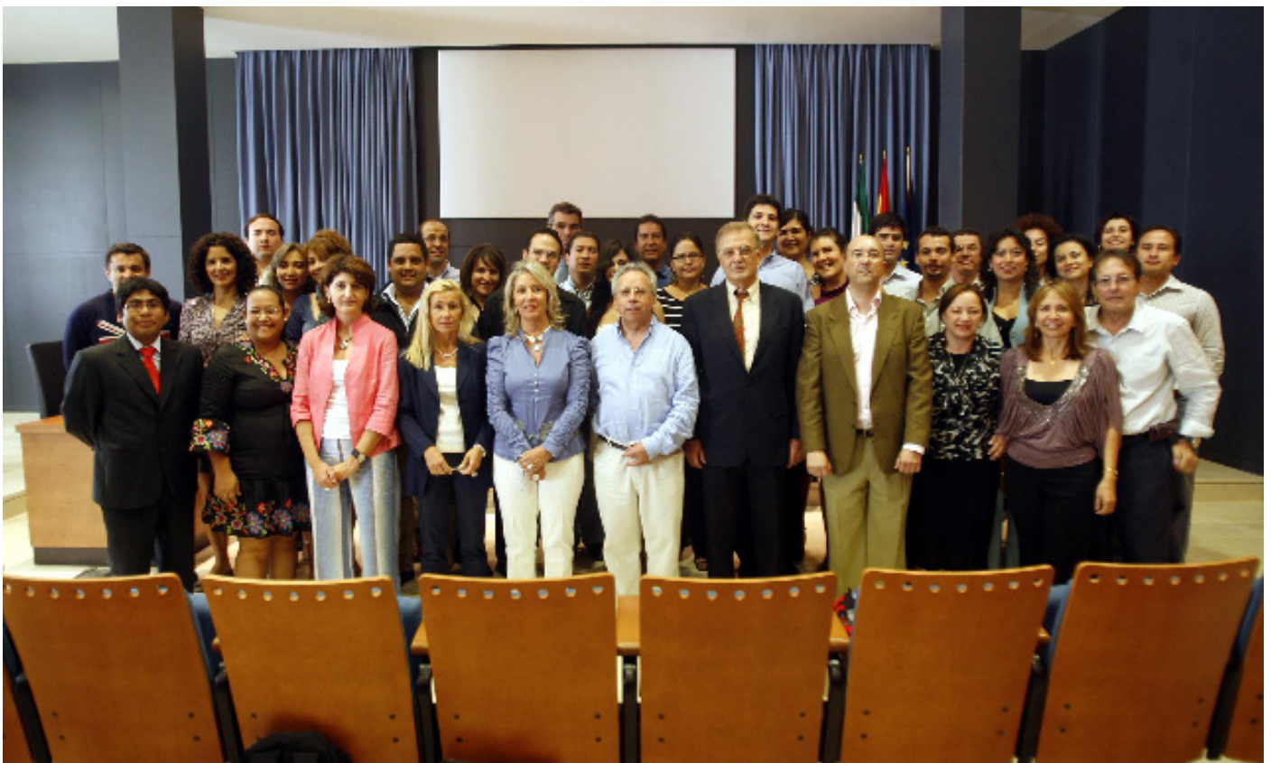
Aumnos de la 3ª edición del Curso Avanzado con las autoridades académicas.

Muy cercana a otras ciudades legendarias como Granada o Córdoba, ella misma fue puerto y puerta de América durante varios siglos, en los que se impregnó del espíritu intercontinental y lo transmitió a las generaciones presentes.