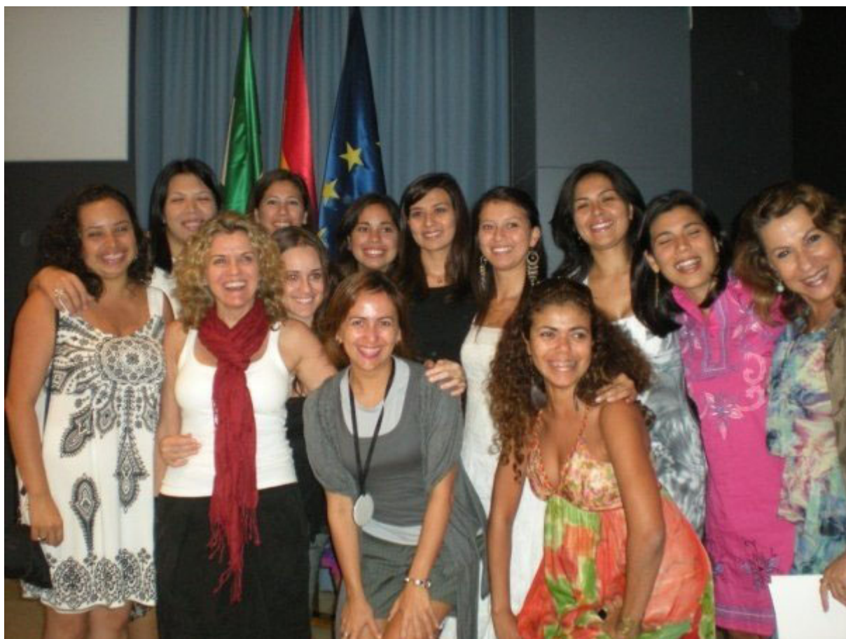
Sonrisas en el día de la graduación

Una puesta al día viva y en muchos casos procedente de los propios alumnos, en Facebook, “IERI SEVILLA”.